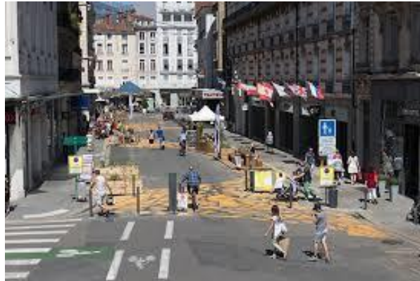
Grenoble : source Gre.mag