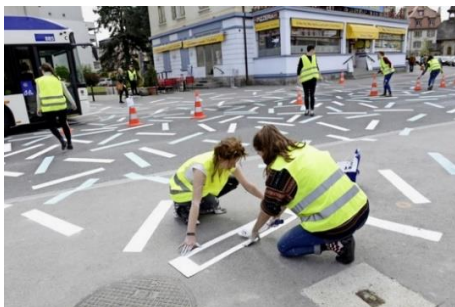
Renens (Suisse)