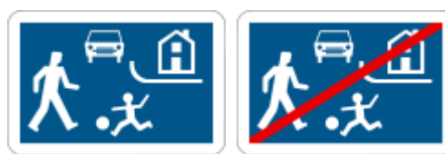
Signal F12a et F12b