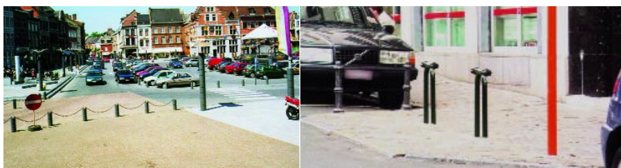
Encore un peu plus de voitures...

Isabelle Janssens, urbaniste, département mobilité et infrastructure, IBSR Tél. : 02/244 15 11 isabelle.janssens@ibsr.be