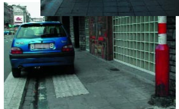
«...mais que reste-t-il de nos trottoirs?»