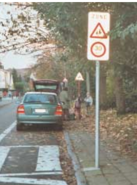
VUE – Les "zones 30" sont signalées par des panneaux rectangulaires qui marquent l'entrée (F4a) ou la sortie (F4b) de la zone, surmontés du triangle "école" représentant 2 enfants (A23).

Davantage d'informations peuvent être obtenues en consultant la brochure de l'IBSR, éditée à l'attention des gestionnaires de voiries : "30 km/h aux abords des écoles. Pour une meilleure sécurité routière aux abords des écoles et sur les chemins qui y mènent", parue en juin 2002.