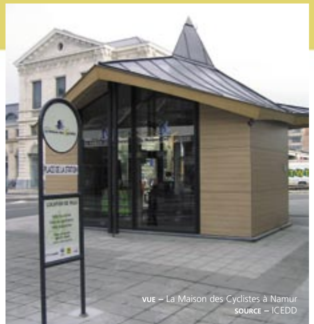
VUE – La Maison des Cyclistes à Namur