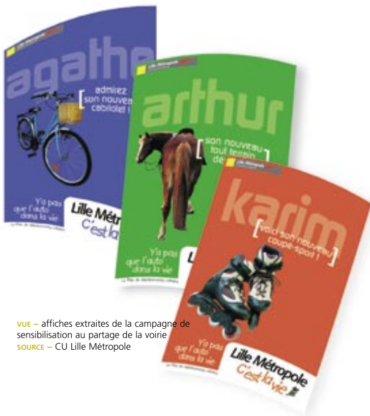
VUE – affiches extraites de la campagne de sensibilisation au partage de la voirie

La marche à pied, souvent reléguée au dernier rang des modes de déplacement, mérite de retrouver ses lettres de noblesse et nécessite une réflexion adéquate. Un travail sur l'accessibilité des grands pôles de transport collectif : gare, station de métro, cœur de ville, est intéressant à beaucoup d'égards.