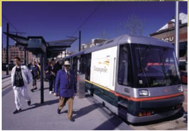
VUE – En matière de transport public, le PDU de Lille a privilégié un réseau hiérarchisé et complémentaire.

En traçant des cercles correspondant à des distances limites à parcourir à pied, on peut mesurer le pourcentage d'habitants qui sont susceptibles d'atteindre ces pôles à pied. Dans Lille intra-muros, deux tiers des déplacements se font à pied. À Tourcoing, ce chiffre est plus faible mais reste néanmoins supérieur à 50%. Dorénavant, la Communauté urbaine va également prendre en charge des cheminements qui ne font pas partie du réseau de voiries et être plus attentive au réseau de trottoirs.