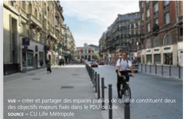
VUE – créer et partager des espaces publics de qualité constituent deux des objectifs majeurs fixés dans le PDU de Lille.

La mise en œuvre du bus à haut niveau de service a pris beaucoup de temps. En effet, le partage de l'espace public pose de nombreuses difficultés et il a fallu cinq années avant que ne soient entreprises les premières réalisations.