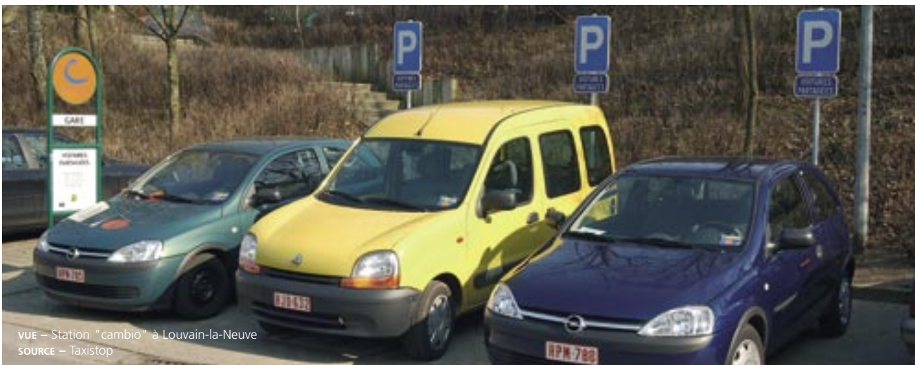
VUE – Station "cambio" à Louvain-la-Neuve

Frédéric VAN MALLEGHEM Taxistop Wallonie Tél. : 010 23 58 01 wallonie@cambio.be