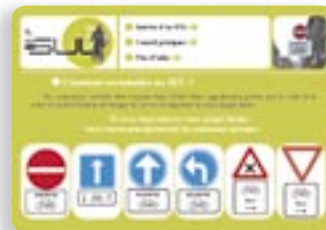
VUE – Campagne d'information et de sensibilisation au SUL, Ville de Liège

Réglementairement obligatoire depuis le 1er juillet 2004, la généralisation des rues en SUL (sens unique limité, accessible dans les deux sens aux cyclistes) n'a pas encore abouti à des réalisations concrètes dans bon nombre de communes. Il est vrai que les réticences et les habitudes à vaincre restent grandes ! Or, pour les cyclistes, le SUL signifie un gain énorme d'accessibilité. Ce sont des villes et des communes où il est plus facile et plus direct de se déplacer à vélo, avec à la clé une modération générale des circulations (particulièrement des vitesses) et donc une qualité de vie et une sécurité améliorées pour tous.