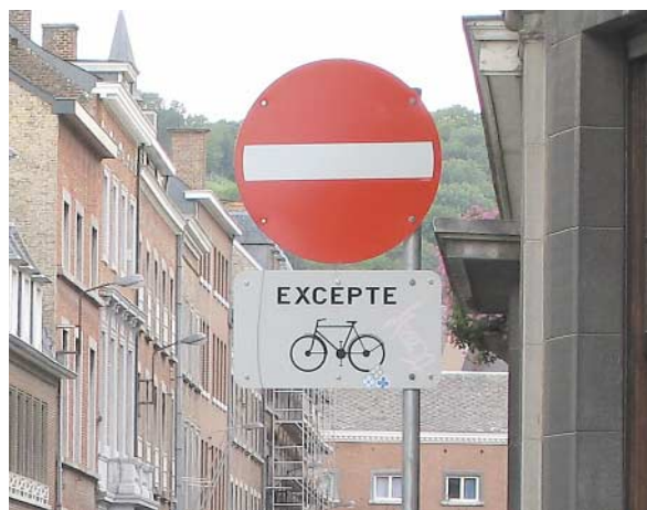
VUE – SUL de la rue Pépin à Namur

L'Union des Villes et Communes de Wallonie et ses associations sœurs bruxelloise et flamande avaient en effet demandé au Ministre le report de la généralisation des sens uniques limités. Le Ministre fédéral a pourtant jugé que les communes avaient été informées suffisamment tôt et qu'elles devront faire le nécessaire pour que les SUL soient mis en œuvre dans les temps, quels qu'en soient les coûts. Le Ministre a ajouté qu'il en allait de la responsabilité des communes quant au dépassement des délais (3) .