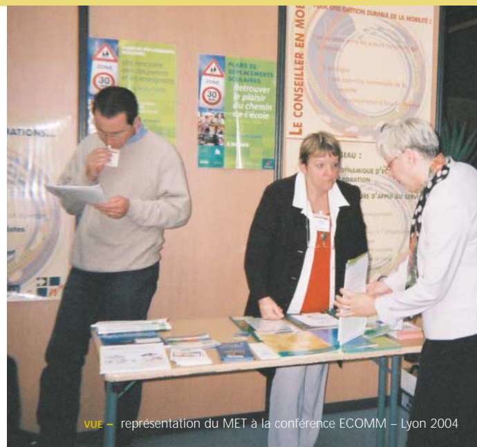
VUE - représentation du MET à la conférence ECOMM - Lyon 2004

À cet égard, soulignons le projet européen "Tapestry", qui a étudié comment développer des programmes de communication efficaces pour appuyer les politiques de transport durable et pour encourager des pratiques rencontrant ces politiques.