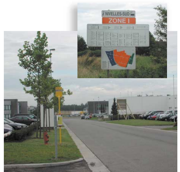
VUES – zone d'activités industrielles de Nivelles Sud