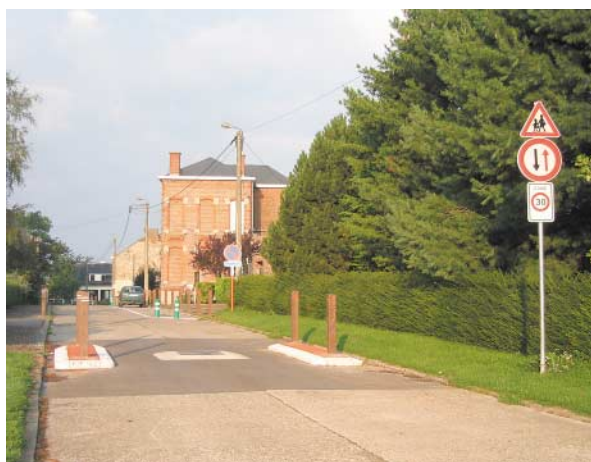
VUE – aménagement de zone 30km/h aux abords d'une école à Cognelée.

Des dispositions concernent la simplification de la réglementation relative à la création de zones 30. En effet, les conditions d'instauration des zones dans lesquelles la vitesse est limitée à 30 km/h prévues dans l'arrêté royal du 9 octobre 1998 sont supprimées. L'accès d'une zone 30 devant toujours être reconnaissable pour l'utilisateur de la route, par la configuration des lieux ou par un aménagement, voire par les deux. La signalisation des zones 30 reste bien sûr indiquée par les panneaux F4a et F4b. Le gouvernement estime nécessaire, pour des raisons de sécurité, de généraliser les zones 30 aux abords des écoles, sauf circonstances exceptionnelles, justifiées par l'état des lieux, les abords de chaque établissement scolaire doivent être délimités par cette mesure d'ici la rentrée scolaire 2005 . Voilà qui risque de susciter de nombreuses interrogations chez les gestionnaires de voirie. C'est pourquoi, une formation continue à l'intention des conseillers en mobilité pourrait être organisée sur le thème de la zone 30 prochainement.