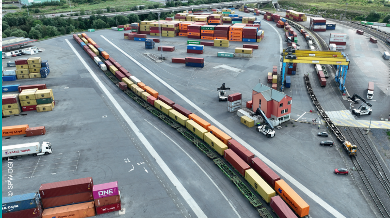
UTI maritimes (transport ferroviaire)