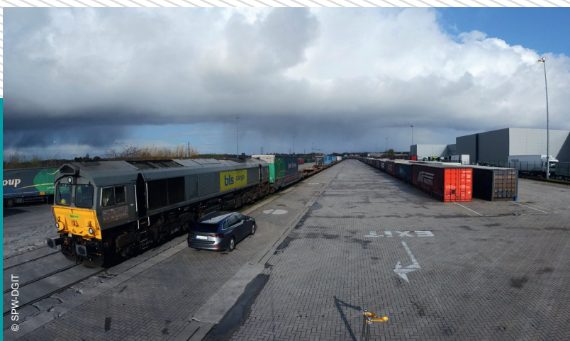
UTI continentaux ferroviaires

2 liaisons par semaine avec Zhengzhou (Chine)