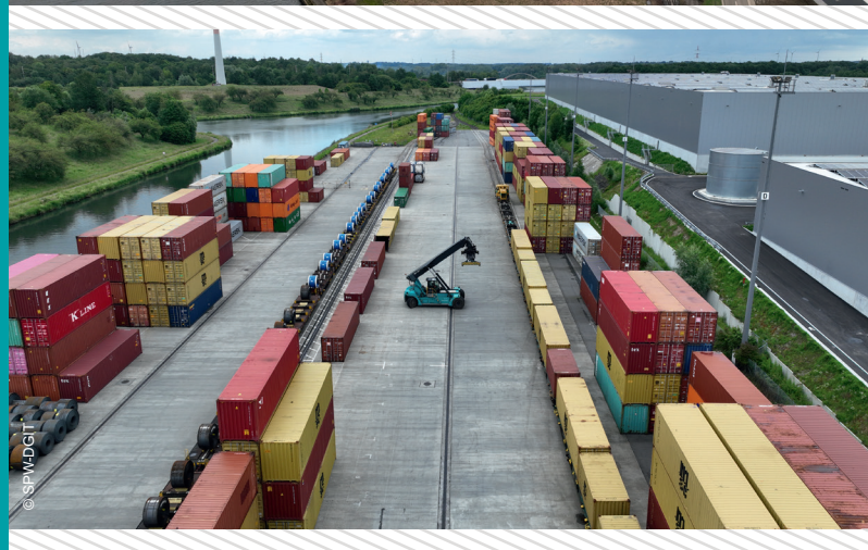
TEU maritimes (transport fluvial)