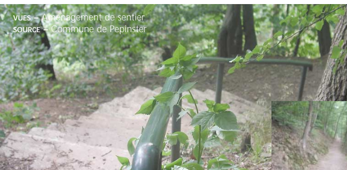
VUES – Aménagement de sentier