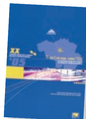
Programme du congrès

Contact : http://www.congresbelgedelaroute2005.be/pageFR01.html