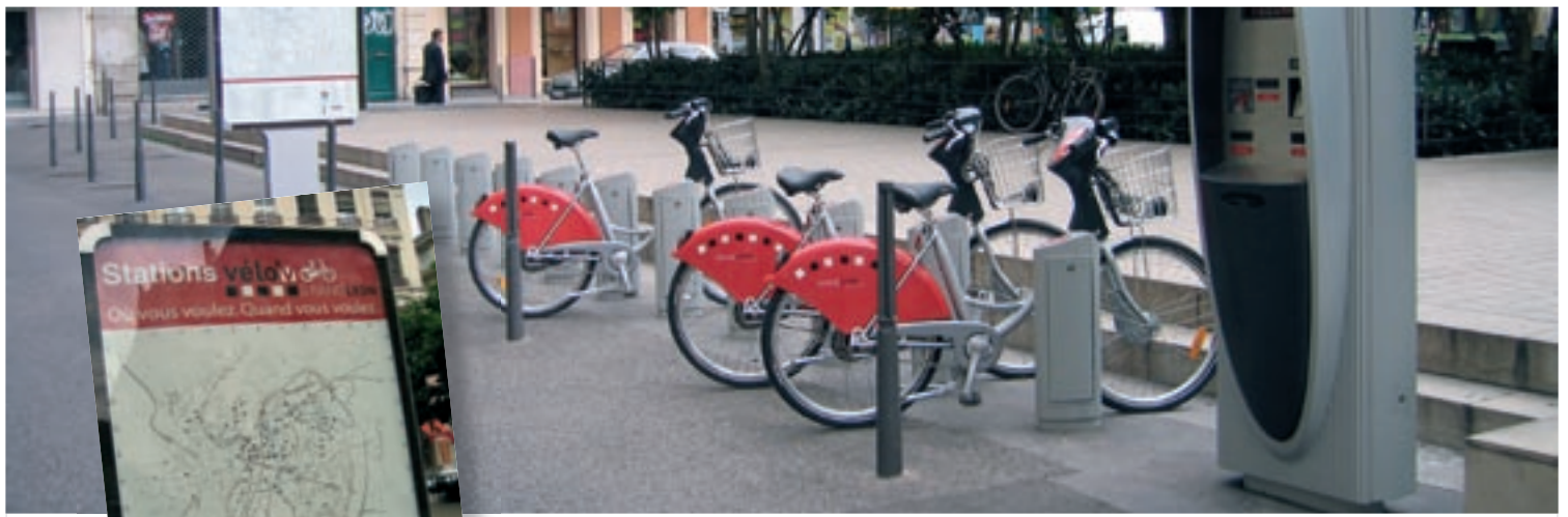
Station de location de vélos à Lyon.