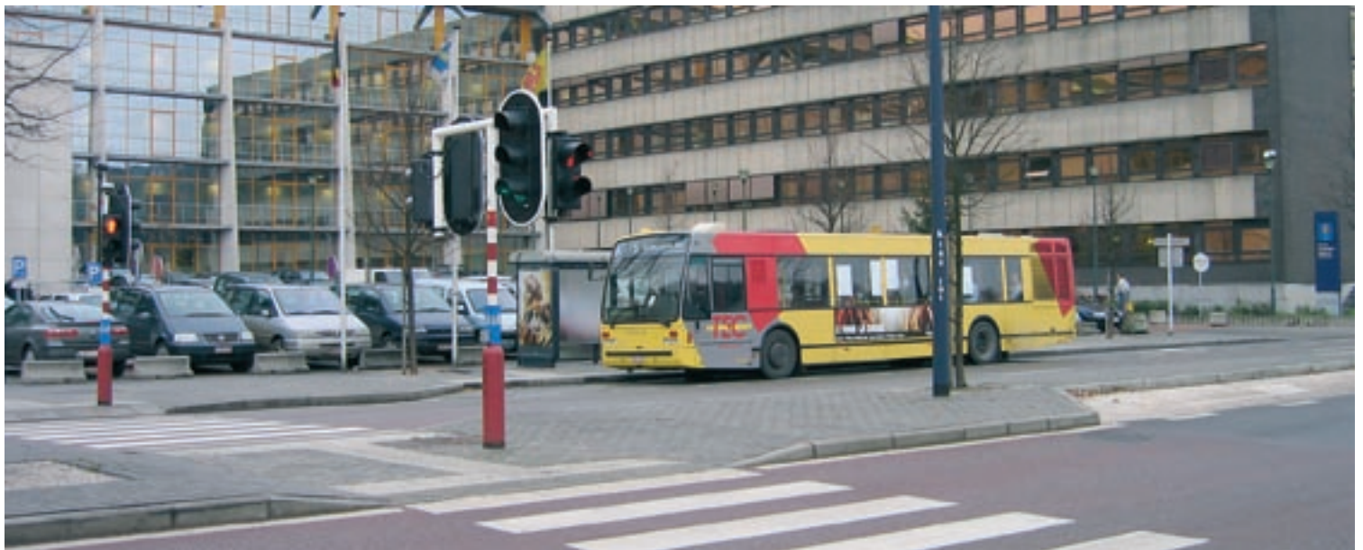
Accès pour piétons sécurisé à l'approche du CHRN.