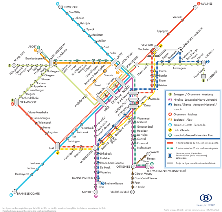
Les lignes de bus exploitées par la STIB, le TEC ou De Lijn viendront compléter les liaisons ferroviaires du RER. Projet d'étude pouvant encore être sujet à modifications.