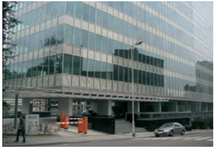
Bruxelles : immeubles de bureaux à proximité du Jardin botanique