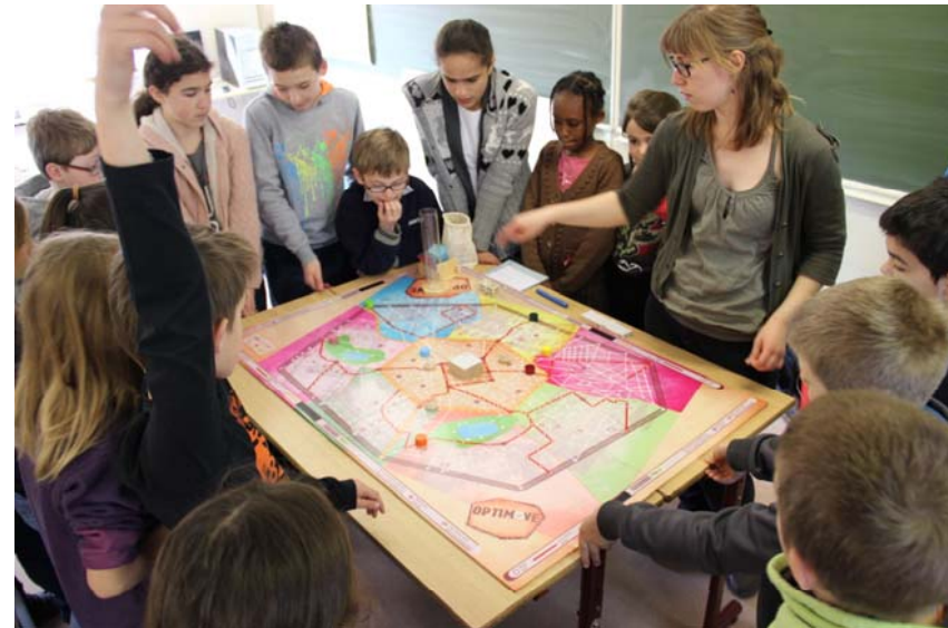
Jeu de société : Optimove